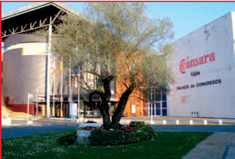
Vista exterior del Palacio de Congresos y Exposiciones “Luis Adaro” en las instalaciones de la Cámara de Comercio de Gijón

AsturFranquicia , Feria de la Franquicia en Asturias, celebrará los próximos días 15 y 16 de noviembre en Gijón su III Edición. La Feria será el encuentro entre Centrales Franquiciadoras, Consultoras especializadas en Franquicia y emprendedores e inversores interesados en adherirse al sistema de Franquicia.